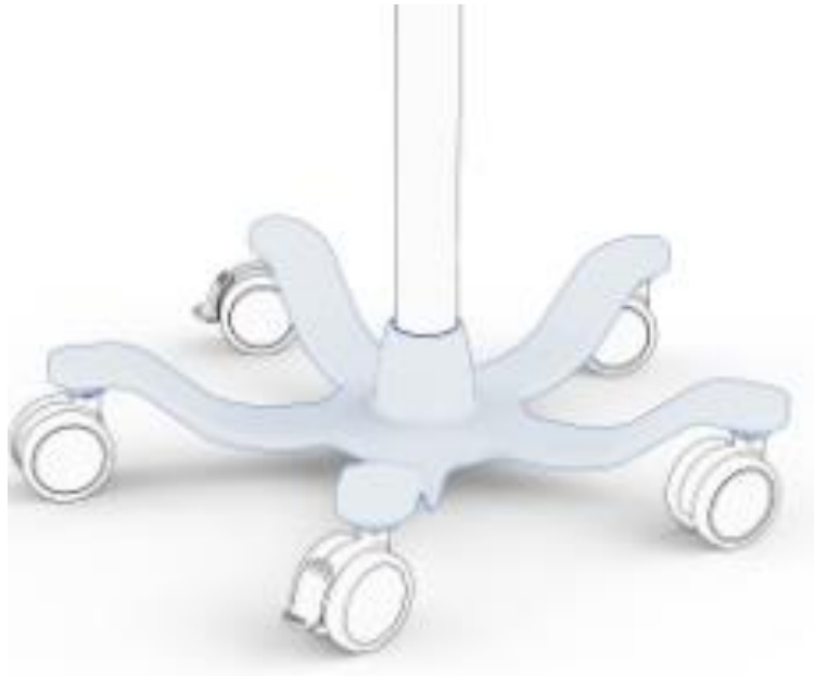
איור 2 - בסיס גלגלים אלומיניום עם חמישה גלגלים ושני מעצורים