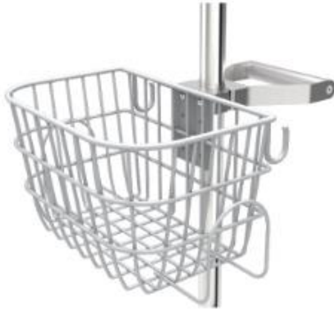
איור 3- סל שירותים עם שני קרסים וידית אחיזה

(2) קרסים לניהול כבלים, כפי שמוצג באיור 3 :