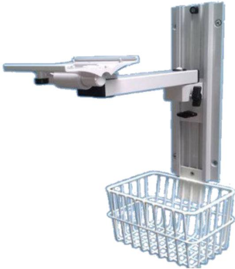
איור 4 – זרוע עם מסילה ייעודית מתכווננת לגובה + סל שירותים